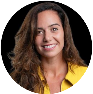
Sarah Knafo Députée européenne

Née en Seine-Saint-Denis, Sarah Knafo est Diplômée de Sciences Po Paris et de l'École Nationale d'Administration. Elle a exercé les fonctions de magistrate à la Cour des Comptes, elle a également travaillé à la préfecture de Seine-Saint-Denis, la préfecture des Pyrénées-Atlantiques, ainsi qu'à l'ambassade de France en Libye. Depuis 2024, Sarah Knafo est députée européenne et Vice présidente du groupe Europe des Nations Souveraines (ENS). Dans le cadre de ses fonctions parlementaires, elle siège au sein de la commission de l'industrie, de la recherche et de l'énergie (ITRE). Récemment, elle a été rapporteure d'un rapport sur la souveraineté technologique européenne.