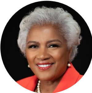
Donna Brazile Ancienne Présidente du Comité National Démocrate

Donna Brazile est une stratège politique américaine, commentatrice pour ABC News et ancienne présidente du Fulbright Foreign Scholarship Board. Professeure associée à Georgetown University, elle a également occupé la chaire King en politiques publiques à Howard University. Figure majeure du Parti démocrate américain, elle a assuré à deux reprises la présidence par intérim du Democratic National Committee (DNC). Au sein du DNC, elle a fondé le Voting Rights Institute et exercé les fonctions de vice-présidente chargée de l'engagement civique et de la protection du droit de vote. En 2000, elle entre dans l'histoire en devenant la première Afro-Américaine à diriger la campagne présidentielle d'un grand parti national, en tant que directrice de campagne du vice-président Al Gore.