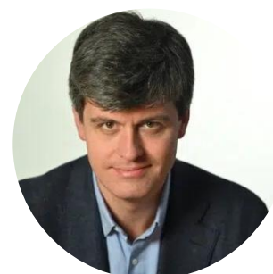
Gaspard Koenig Philosophe, essayiste et romancier

Gaspard Koenig est philosophe, essayiste et romancier français. Ancien élève de l'École normale supérieure de Lyon et agrégé de philosophie, il poursuit également des études à Columbia University à New York avant d'enseigner la philosophie à Sciences Po. Il travaille ensuite au cabinet de Christine Lagarde au ministère de l'Économie puis à la Banque européenne pour la reconstruction et le développement (BERD) à Londres.