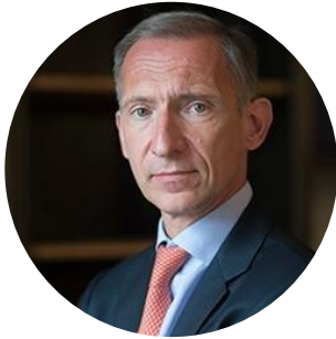
Nicolas Baverez Ecrivain et essayiste

Nicolas Baverez est un avocat, historien et économiste français. Ancien élève de l'École normale supérieure (1980) et de l'École nationale d'administration (1988), il est agrégé de sciences économiques et sociales et docteur en histoire. Il commence sa carrière à la Cour des comptes en 1988, puis devient conseiller au cabinet de Philippe Séguin, président de l'Assemblée nationale, de 1993 à 1995. Admis au barreau de Paris en 1998, il exerce en droit public économique, notamment chez Gibson, Dunn & Crutcher LLP pendant 18 ans, avant de rejoindre le cabinet August Debouzy en 2023 en tant qu'associé. Essayiste influent, il est l'auteur de nombreux ouvrages, dont Violence et passions (2018, prix Vauban) et Démocraties contre empires autoritaires (2023). Éditorialiste régulier pour Le Figaro et Le Point , il est membre du comité directeur de la revue Commentaire et de l'Institut Montaigne, où il préside le groupe de travail Affaires étrangères et défense.