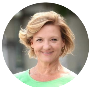
Monica Frassoni Présidente de l'EUase et de ECES (Centre Européen d'Appui Electoral)

Verneuil-sur-Seine est une commune des Yvelines de 17 000 habitants dont le premier maire après la Révolution française fut Hervé comte Clérel de Tocqueville (le père d'Alexis de Tocqueville ; qui y passa une partie de son enfance notamment avec son cousin François René de Chateaubriand). La commune s'est faite connaître en 2020 par l'un des premiers référendums locaux organisé à l'initiative de la mairie, pour obtenir le sauvetage d'une forêt régionale, menacé par un projet routier désormais abandonné.