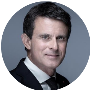
Manuel Valls Ancien Premier Ministre français

Manuel Valls est un homme d'État franco-espagnol et ancien Premier ministre français de 2014 à 2016 sous la présidence de François Hollande. Né à Barcelone, il rejoint très tôt la vie politique française après des études d'histoire à l'Université Paris I Panthéon-Sorbonne. Proche de Michel Rocard dans ses débuts, il devient maire d'Évry en 2001 puis député de l'Essonne en 2002.