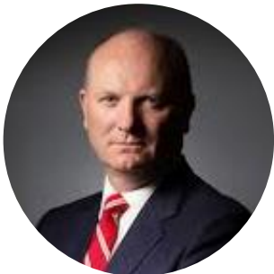
Declan Ganley CEO, Rivada Networks, Fondateur, Libertas

Declan Ganley est un entrepreneur irlandais spécialisé dans les télécommunications et les technologies de communication sécurisées. Fondateur, président et directeur général de Rivada Networks, il a créé et développé plusieurs entreprises dans les secteurs des réseaux sans fil, des infrastructures numériques et des communications sécurisées en Europe et aux États-Unis. Aujourd'hui, il dirige également Rivada Space Networks, qui développe une constellation de satellites destinée aux communications gouvernementales, commerciales et stratégiques.