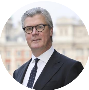
Malcolm Offord Chef du parti Reform; UK Ecosse

Lord Offord of Garvel CVO (Malcolm Offord MSP) est un homme d'affaires écossais nommé Parliamentary Under Secretary of State au Scotland Office en octobre 2021. En avril 2023, il est également nommé ministre britannique chargé des Exportations au sein du Ministère du Commerce. À la suite des élections générales britanniques de 2024, Lord Offord rejoint l'opposition à la Chambre des Lords comme porte-parole conservateur chargé des questions d'énergie et de neutralité carbone. En décembre 2025, il quitte le Parti conservateur pour rejoindre Reform UK. Il est officiellement nommé chef de Reform UK Scotland en janvier 2026. Lord Offord conduit ensuite Reform UK Scotland lors des élections au Parlement écossais de 2026, annonçant sa candidature dans la circonscription d'Inverclyde pour obtenir un siège à Holyrood. Lors du scrutin de mai 2026, bien que le parti ne remporte aucune circonscription au scrutin direct, Reform UK Scotland obtient 17 députés régionaux (MSPs) grâce au vote de liste, arrivant à égalité avec le Scottish Labour à la deuxième place. Avant d'entrer en politique, Lord Offord a fondé en 2013 le family office Badenoch & Co..