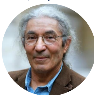
Boualem Sansal Ecrivain, essayiste

Boualem Sansal est un écrivain et essayiste franco-algérien parmi les grandes figures contemporaines de la littérature francophone. Ingénieur et docteur en économie de formation, il a exercé comme haut fonctionnaire au ministère algérien de l'Industrie avant de se consacrer à l'écriture. Il se fait connaître en 1999 avec Le Serment des barbares, récompensé par plusieurs prix littéraires.