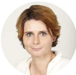
Caroline Fourest Directrice de la rédaction et Fondatrice de Franc Tireur, Essayiste