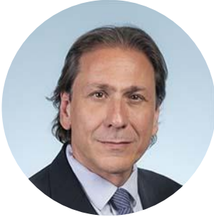
Jérôme Guedj Député français

Jérôme Guedj est député français de l'Essonne et inspecteur général des affaires sociales. Engagé de longue date dans la vie politique française, il débute son parcours au Parti socialiste dans les années 1990, aux côtés notamment de Jean-Luc Mélenchon et Julien Dray. Il exerce plusieurs responsabilités locales et nationales, notamment comme président du conseil général de l'Essonne entre 2011 et 2015. Spécialiste des questions sociales et de santé publique, il siège à la commission des Affaires sociales de l'Assemblée nationale. Il intervient régulièrement dans le débat public sur les retraites, les politiques sociales et les institutions démocratiques. Figure de la gauche républicaine française, il participe fréquemment aux grands débats politiques et médiatiques contemporains.