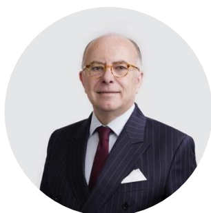
Bernard Cazeneuve Ancien Premier Ministre français

Bernard Cazeneuve est un homme d'État français et ancien Premier ministre de la République française de 2016 à 2017 sous la présidence de François Hollande. Avocat de formation, diplômé de l'Institut d'études politiques de Bordeaux, il débute sa carrière politique comme élu local en Normandie avant de devenir député de la Manche.