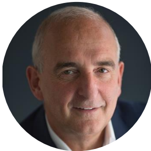
Roger Cohen Journaliste, Chroniqueur au New York Times

Roger Cohen est journaliste, essayiste et chroniqueur au New York Times, où il couvre les grandes questions internationales et politiques depuis plus de trois décennies. Né à Londres et élevé au Royaume-Uni et en Afrique du Sud, il étudie à l'Université d'Oxford avant de débiter sa carrière dans la presse britannique puis américaine.